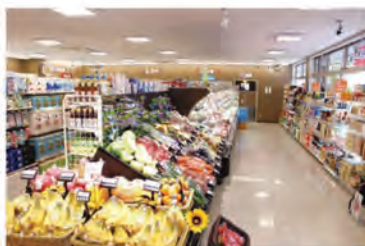
通常のコンビニにはない、 入口付近の青果・農産売場