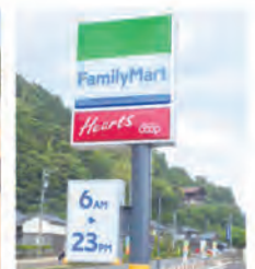
営業時間は 朝6時から夜11時まで