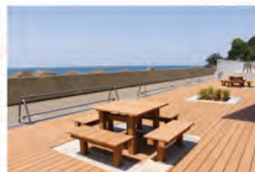
開放感のある、店舗ウラの オープンテラス