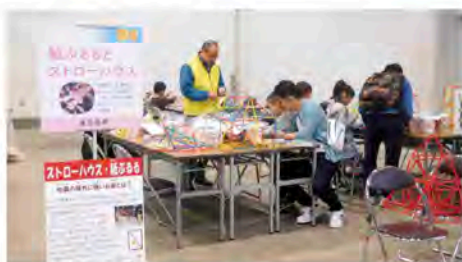
地震に強い家づくり体験ブース:ストローハウス

3月25日(日)に福井県産業会館1号館において「家族で楽しく学ぶ!防災・減災フェア」を開催しました。全労済福井推進本部と共同主催での初めての取り組みでしたが、1,200名の入場者があり、様々な体験ブースを通して防災・減災に対する知識を深めていただけたことと思います。今年度も形を変えて開催する予定でありますので、どうぞお楽しみに!ご協力いただきました各団体の皆様、ありがとうございました。