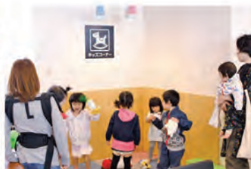
店内コミュニティスペース横の キッズコーナー