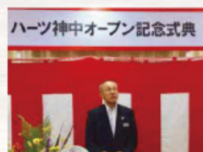
竹生理事長ごあいさつ

関係者の皆様をお迎えし、オープン記念式典・オープニングセレモニーを開催いたしました。開店と同時に組合員、地域の皆様に多数ご来店いただきました。お近くにお越しの際は、ぜひお立ち寄りください。