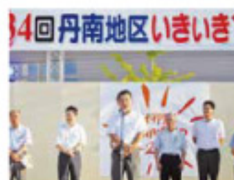
横山会長あいさつ

8/25(土)連合福井丹南地域協議会主催で毎年恒例の「丹南地区いきいき夏まつり」が武生中央公園だるまちゃん広場にて開催されました。労福協としましては、今年も「チームろうふく」として飲み物の販売ブースを出展し、おたのしみ抽選会の景品として「ランチつき映画観賞券」を提供させていただきました。