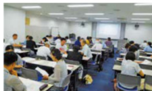
4人ずつに分かれてのグループワーク