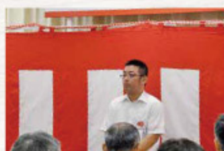
湯川店長より決意表明