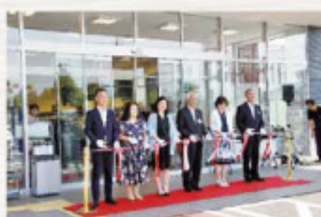
組合員と共にテープカット