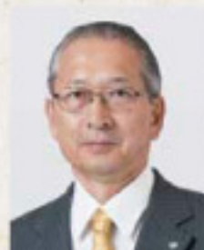
労働者福祉中央協議会 会長 神津 里季生

これからも「福祉はひとつ」という労福協の原点を大切に、それぞれの多様性を認め合いながら、様々なネットワークで「つながる運動」を広げ、ともに新しい社会や時代を切り拓いていきましょう！