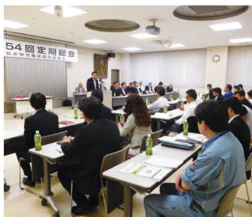
54回定期総会 福井県労働者福祉協議会

私たちは、様々な活動を通してながら事業団体、連合福井との連携を一層深め、少しでも労働者や県民の福祉向上に繋がる活動になればと、この一年を取り組んでまいりました。