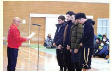
優勝はAW-I労組1軍の皆様でした!