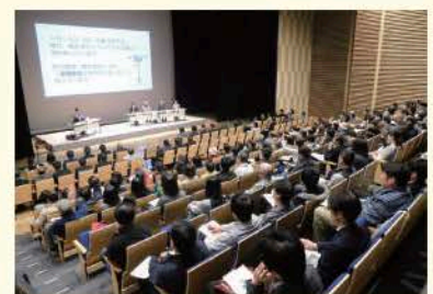
パネルディスカッション風景