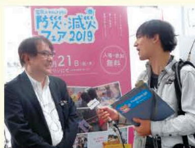
FBCラジオ「エコーメイト」も取材に来られました

3月21日(木・祝)ハピテラスにおいて「防災減災フェア2019」を開催しました。ハピリンホールでの「人はなぜ逃げないのか」をテーマとしたパネルディスカッションには、会場がほぼ満席になるほどのご来場をいただきました。ハピテラスでの各種体験ブース、ステージショーには約1,300名の来場があり、楽しく体験しながら防災について学び、意識を高めていただけたことと思います。今年度も3月に開催を予定しており、皆様のお役に立てるイベントとなるよう、企画して参ります。