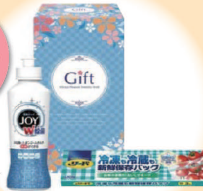
除菌ジョイ キッチンセット