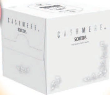
スコッティ カシミアキューブ