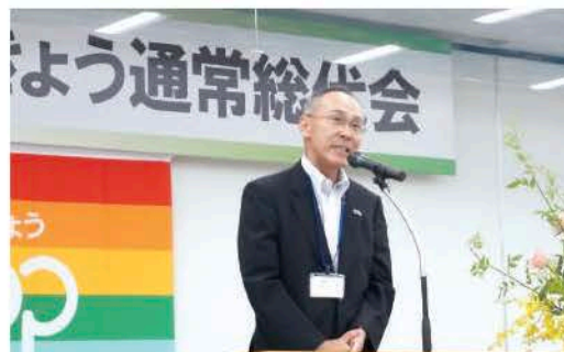
竹生理事長あいさつ

今年は新たな物流センターの準備やハーツつるがのリニューアル(秋)、あわら市での介護施設、鯖江市での社会福祉法人設立に向けて準備を進めるなど新たな事業に取り組むとともに、SDGs(持続可能な開発目標)の実現に向けて、組合員、地域とともに役職員一同まい進して取り組んでまいります。1年間よろしくお願ひ致します。