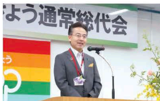
杉本知事ごあいさつ