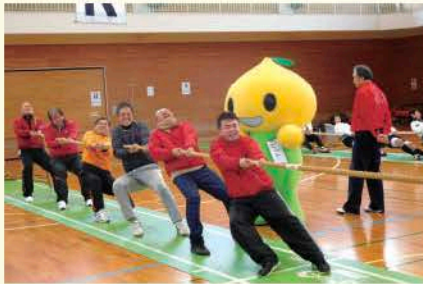
こくみん共済coopの愛らしいキャラクター、ピットくんも応援に駆けつけてくれました

1月20日(日)福井市綱引協会他3団体と共催で第29回福井勤労者綱引フェスティバルを福井市北体育館で開催しました。毎年、多くの方に参加していただくように、連合福井および労働福祉事業団体に交流の部への参加を呼び掛けています。多くの関係団体の皆さまのご協力で、交流の部には19チームの参加をいただき、当日は大変盛り上がりました。ご協力ありがとうございました。