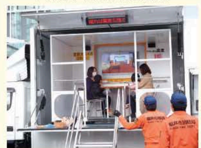
起震車で震度5を体感中