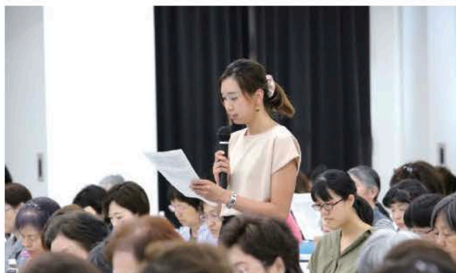
発言する総代さん