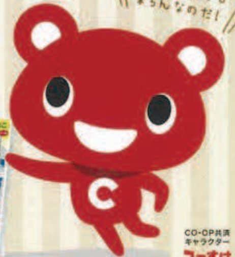
CO-OP共済 キャラクター コープずけ